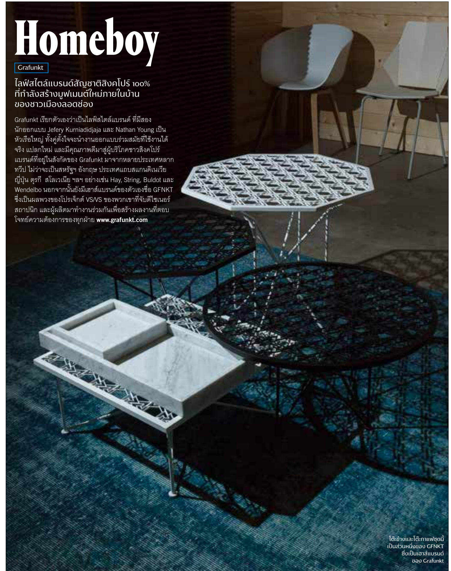
โต๊ะข้างและโต๊ะกาแฟนี้เป็นส่วนหนึ่งของ GFNKTK ซึ่งเป็นเฮาส์แบรนด์ ของ Grafunkt