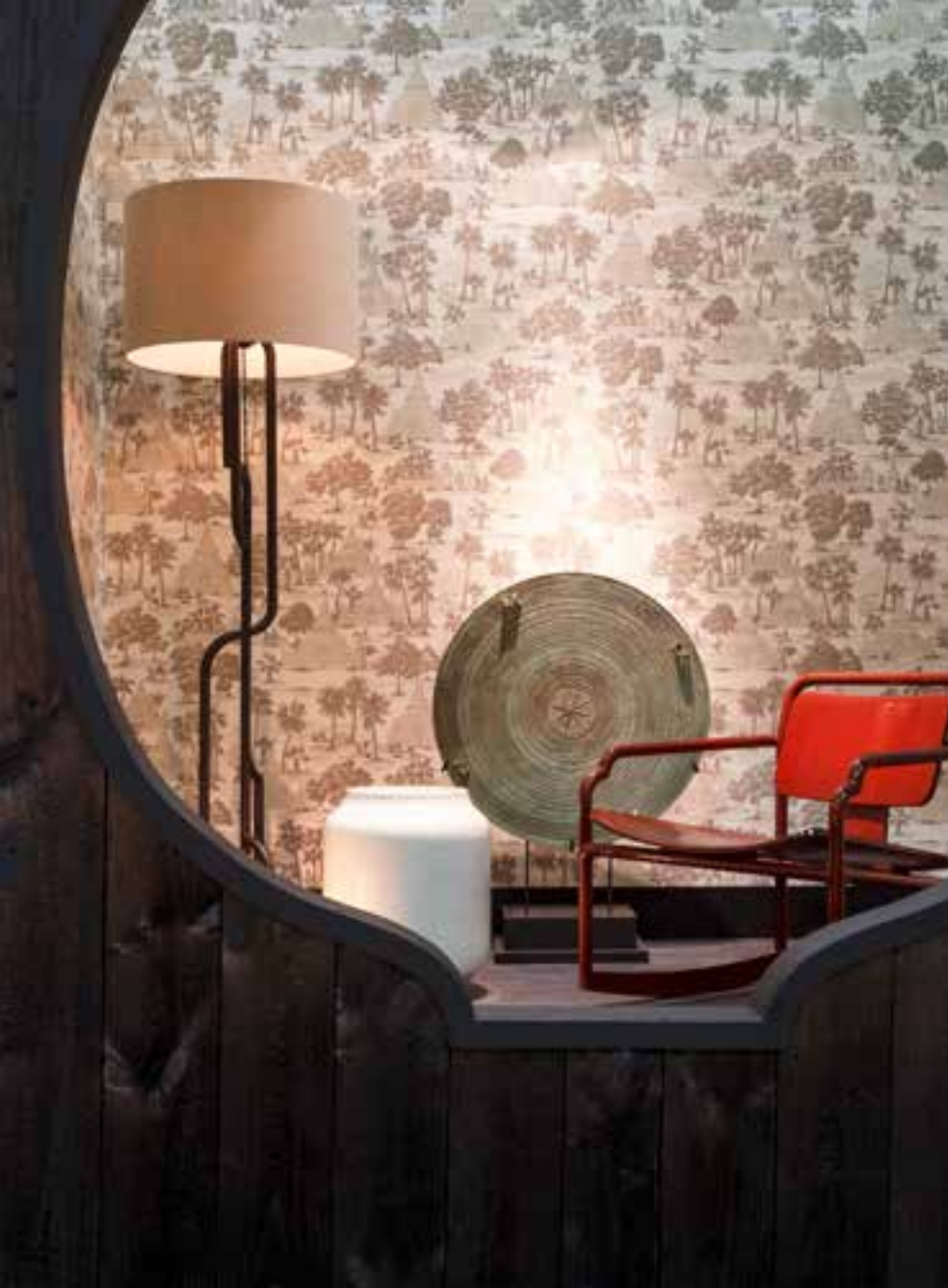
เฟอร์นิเจอร์ของ Akar de Nissim มีกลิ่นอายความเป็นจีนแฝงอยู่ในลายเส้นของชิ้นงาน แต่ถูกนำมาดัดก่อนให้ดูทันสมัย เข้ากับบริบทได้หลากหลายยิ่งขึ้น