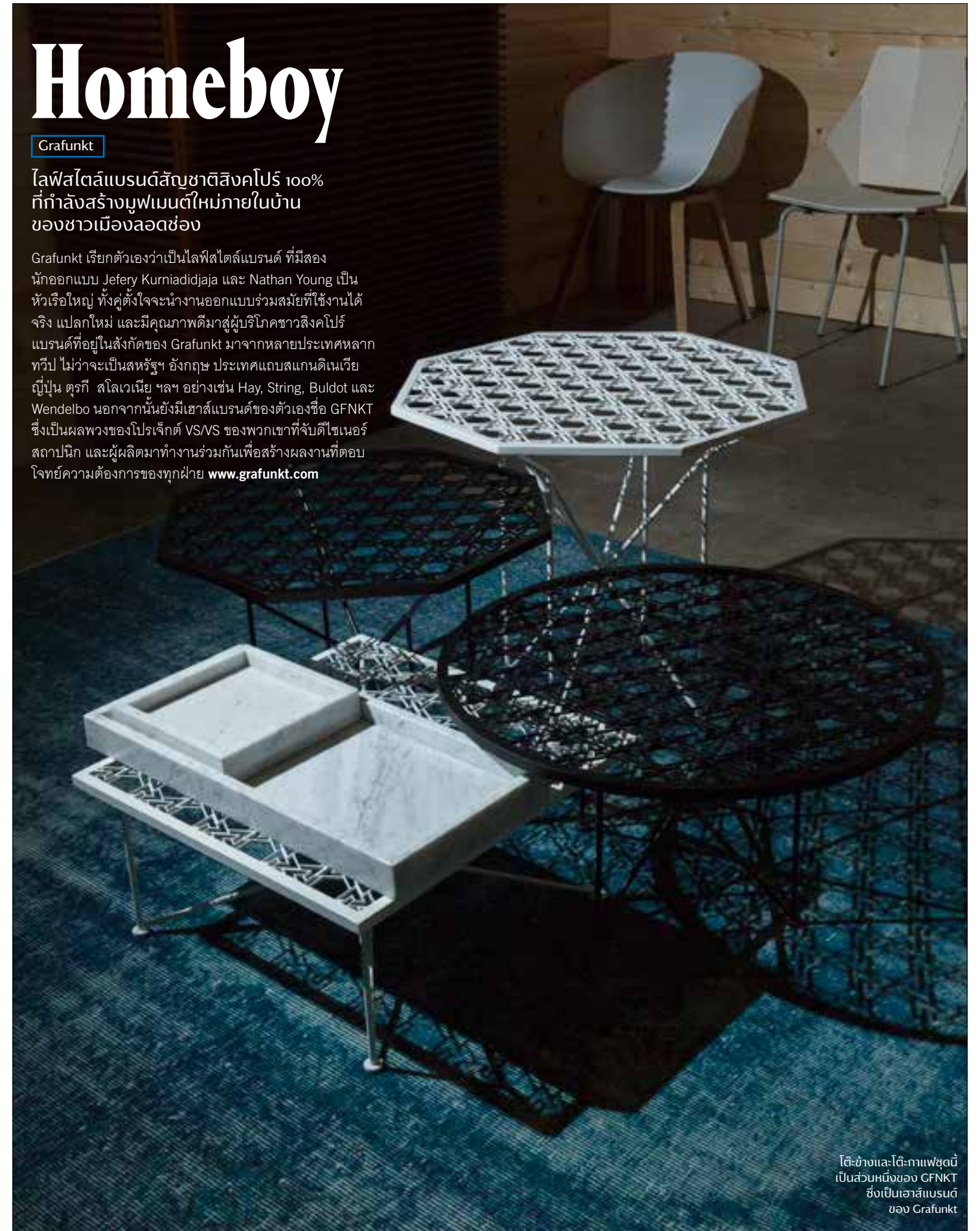
โต๊ะข้างและโต๊ะกาแฟนี้เป็นส่วนหนึ่งของ GFNKTK ซึ่งเป็นเฮาส์แบรนด์ ของ Grafunkt